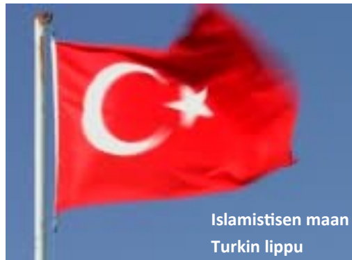
Islamistisen maan Turkin lippu

Katolilainen oppi ja islam ovat syntyneet molemmat Baabelissa. Samiramis/Nimrod aurinkojumalat ovat molempien uskontojen luoja. - Se on äiti-lapsi-kultti.