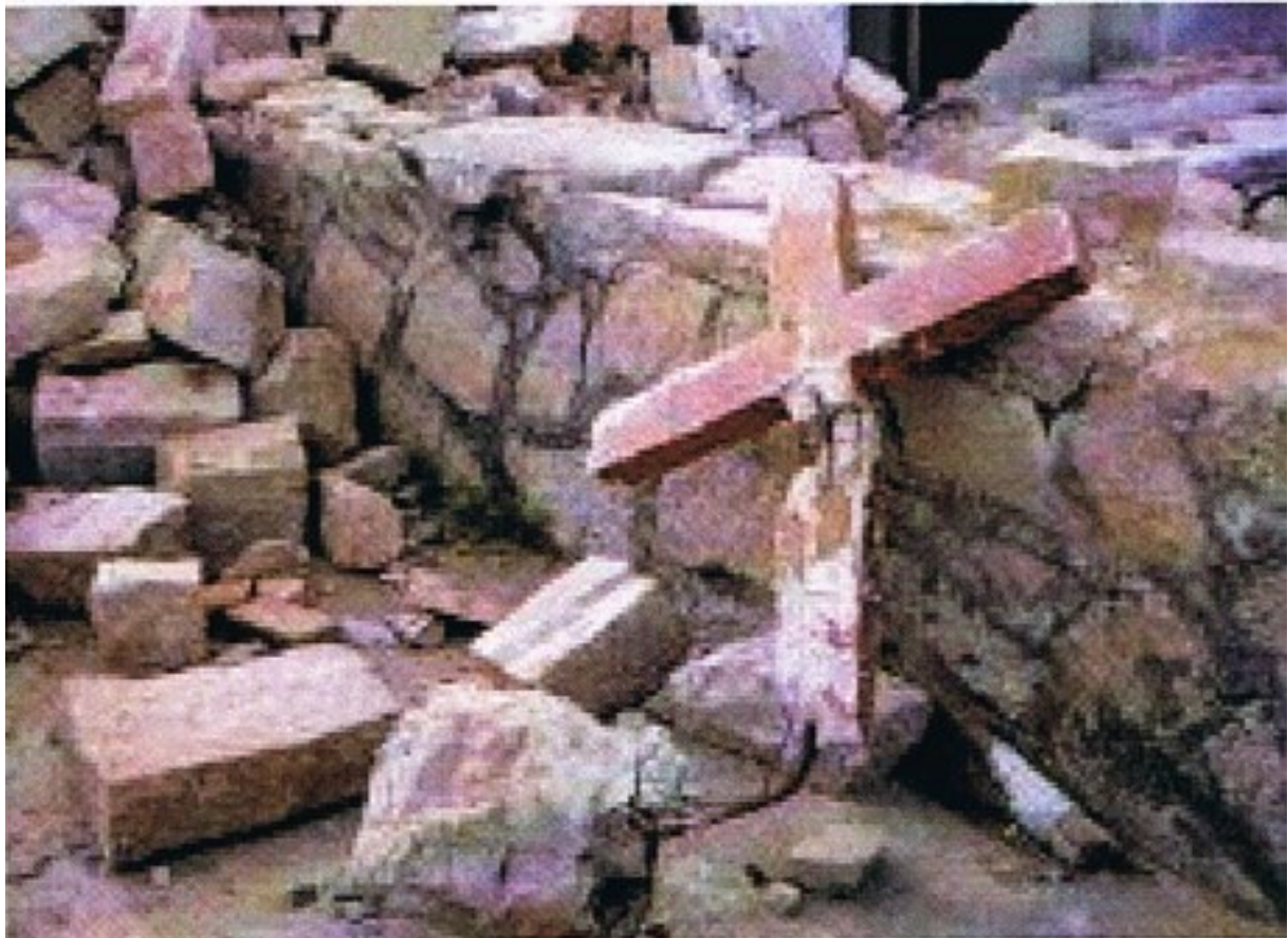
Kuvassa Sha Aon kirkon tuhattu risti

Jeesus on koko maailman keskipiste! Kaikki täällä maan päällä pyörii lopulta Jeesuksen ympärillä. Toiset ihmiset ovat Hänen puolellaan ja toiset ovat vastaan!