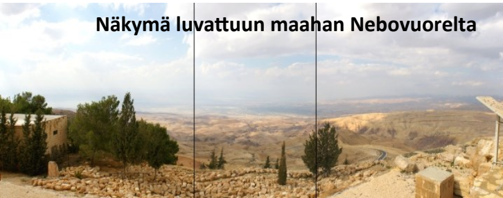
Näkymä luvattuun maahan Nebovuorelta

Israelilaisten piti olla Egyptissä 400 vuotta, kunnes Amorilaisten ym. kansojen syntien mitta tuli täyteen. Jumala antoi heidän maansa Israelilaisille ikuisiksi ajoiksi, kuitenkin siten ehdollisena, että heidän tuli olla kuuliaisia Jumalalle. Sitä he eivät olleet ja he joutuivat pois maastaan, pakkosiirtolaisuuteen n. 1850 vuodeksi. Nyt heistä on jo suuri osa palannut takaisin. Vielä on noin 12 miljoonaa palaamatta! Kaikki palaavat! Maa-alueissakin tulee muutoksia. Maan rajat siirtyvät Libanonin ja Syyrian suuntaan, aina Eufrat-virtaan saakka.