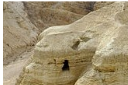
Eräs Qumranin luola

Qumranissa, Israelissa, on tehty todella tärkeitä löytöjä, jotka vahvistavat Raamatun kirjoitusten oikeallisuuden. Tehdyt löydöt vahvistavat myös Israelin kansan oikeuden omaan maahansa. Jumala talletti ne 2000 vuodeksi. Nyt ne ovat vahvistamassa uskoamme Raamattuun.