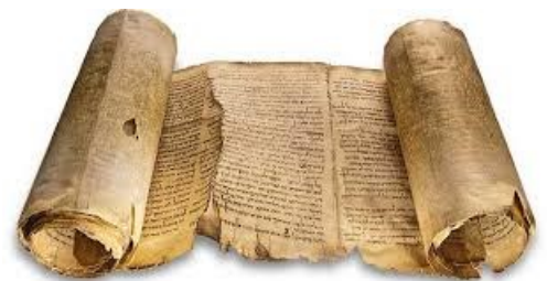
Löydöt rullattuina kääröinä.

Viereisessä kuvassa on Qumranista löydettyjä ”kääröruukkuja.” Ne ovat noin 40-60 senttimetriä korkeita, kapeita varastoruukkuja. Niiden suuaukot ovat melko laajoja niihin kuuluu usein keraamiset, kulhomaiset kannet. Ruukkuja on löytynyt sekä luolista, että rauniosta.