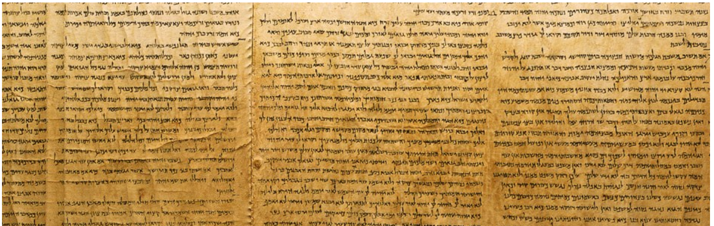
Kuvassa osa eräästä kirjakääröstä