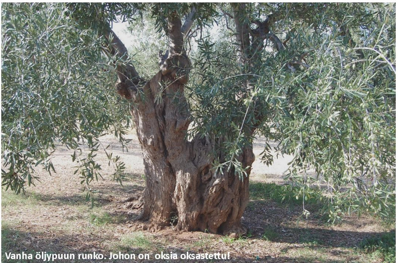
Vanha öljypuun runko. Johon on oksia oksastettu!