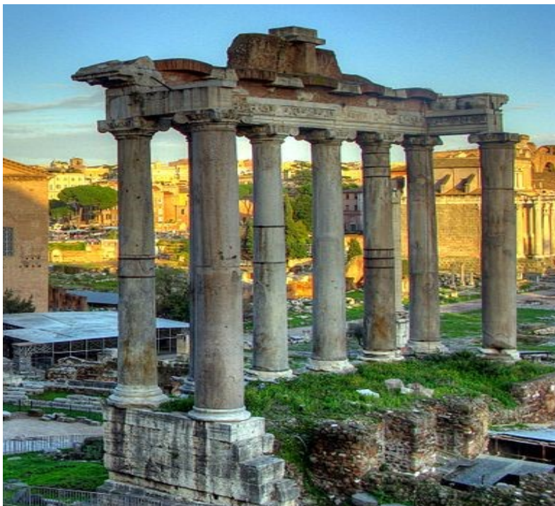
Saturnalia-temppelin raunioita Roomassa

Me kaikki pilkkaamme Jumalaa viettäessämme joulua!