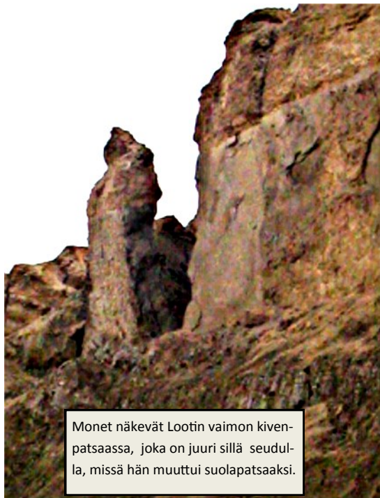
Monet näkevät Lootin vaimon kivenpatsaassa, joka on juuri sillä seudulla, missä hän muuttui suolapatsaaksi.