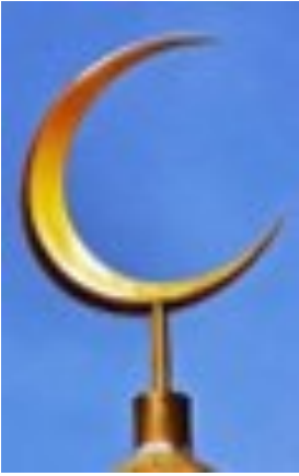
Kuunsirppi moskeijan katolla