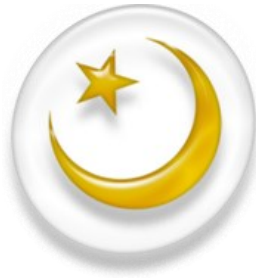
Islamin tunnus: - Kuu on naimisissa auringon kans- sa. Tähdet ovat lapsia.