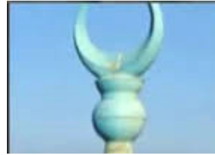
Minareettien katoilla on kuusirppi

Islamin opin mukaan Jeesuksen äiti oli Moosesin sisko Mirjam, joka eli noin vuonna 2600. Hän kuoli Beerebassa autiomaassa. 1200 vuotta ennen Jeesuksen syntymää!