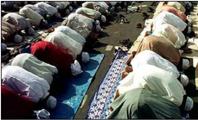
Islamit rukoilevat viisi kertaa päivässä Mekkaan päin, jossa pyhät mustat kivet sijaitsevat!