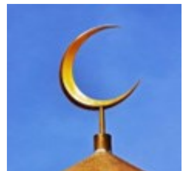
Minareettien katoilla on kuujumalan tunnus!